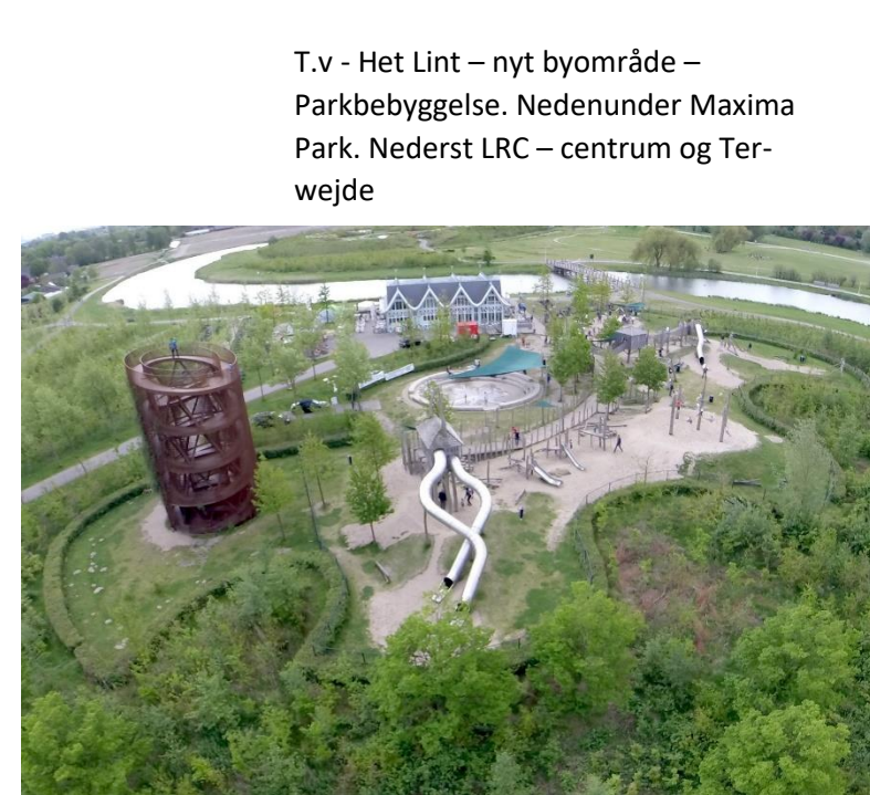
T.v - Het Lint – nyt byområde – Parkbebyggelse. Nedenunder Maxima Park. Nederst LRC – centrum og Terwejde