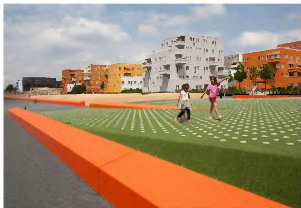
Theresienhöhe – et nyt og omdannet centralbeliggende bolig/ erhvervsområde.