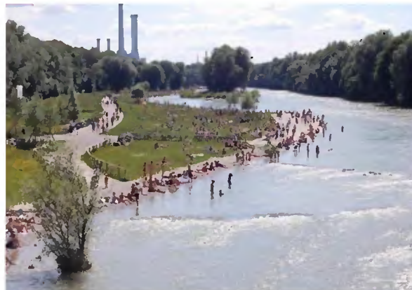
Isvar – grønt åndehul – byens lunge. Nyt rekreativt område og samtidig en naturgenopretning.