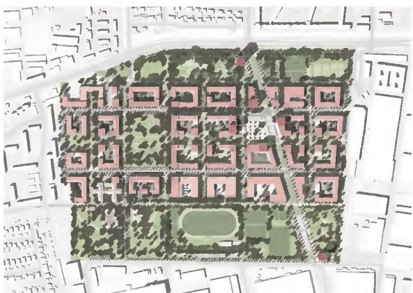
Bayern Kaserne i den nordlige del af byen – tidligere kaserne, som nu ombygges.