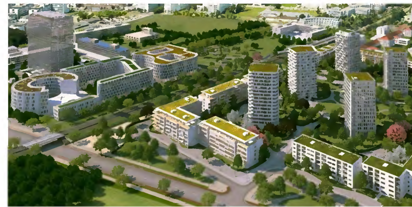
Siemens – Obersendling – et omdannelsesområde i den sydlige del af byen – primært et boligområde.