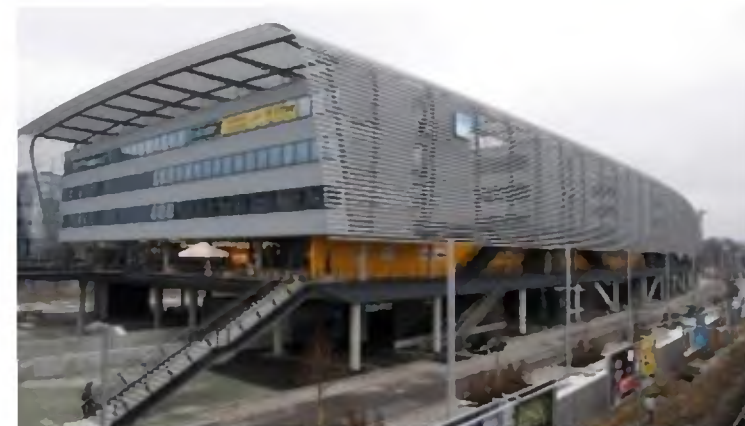
Ombygning af de centrale jernbanearealer . Her ved hovedbanegården