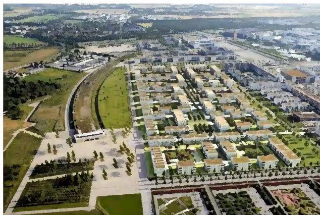
Messestadt – udkanten af München i den østlige del. Omdannelse af et tidligere messe-område.